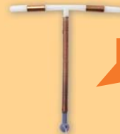
El DIU sin hormonas