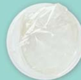
El condón interno (condón femenino)

Usa un condón con cualquier otro método para protegerte de las ITS.