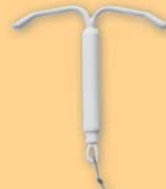
Los DIUs con hormonas